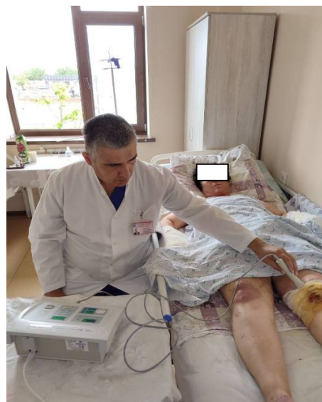
Расим 2. Беморларга лазер терапия утказиш жараёни.

Буғимларнинг яллиғланишни олдини олиш ва лазер терапияни эффективлигини ошириш учун учун зарурий шарт- бу беморларнинг оёқлари буғими соҳасида яллиғланиш аниқланган ҳолатларда буғимларга тушадиган зуриқиш чеклаш, ҳаракат чеклаш кун тартибига амал қилиш керак. Бунда беморлар (хаса таёқ билан юриш, маҳкамлаш кандагас боғламалардан фойдаланиш керак) ва даволовчи шифокорнинг барча тавсияларига амал қилишлари керак. Асосий гуруҳдаги беморлар шикоятлари ва куриқ таҳлилари, буғими соҳаси яллиғланиш ва тикланиш жараёни кузатиб борилди. Даво муолажалари физотерапия ҳар куни куннинг бир хил вақтида олиб борилди. Буғим соҳаси яллиғланиш профилактикаси утказиш эффективлиги бу буғим соҳасидаги доимий ва ҳаракатлар пайтида оғриқ синдромининг камайиши ёки йўқолиши, буғими соҳасида ҳаракатларнинг осон булиш, шишлар ҳолати камайиши кузатилди.