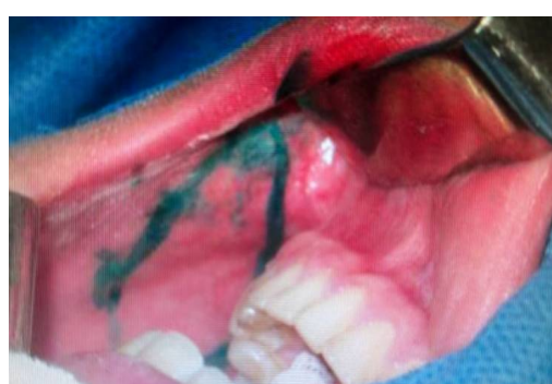
Рис.1 Свободный трансплантат, а также разметка линии для выделения трансплантата.