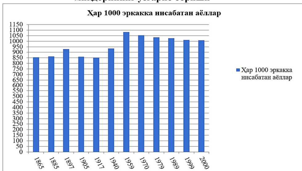
1-диаграмма - Ўзбекистонда ҳар 1000 эркакка тўғри келган аёллар миқдорининг ўзгариб бориши*

*Жадвал қуйидаги адабиётларда келтирилган маълумотлар асосида тузилган: Муллажонов И.Р. Демографическое развитие Узбекской ССР. Ташкент, 1983. С.121; Народное хозяйство УзССР. – 1972 г. Ташкент, 1973. С.10; Женщины в Республике