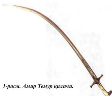
1-рasm. Amir Temur қилчи.

Amir Temur beixtiyor ravishda jahon harbiy san'ati tarixini yangi pog'onalariga ko'tarib, xususan, Yevropa xalqlariga katta xizmat ko'rsatdi. A.Yu.Yakubovskiy Amir Temurning harbiy yutuqlari tufayli ko'pgina mamlakatlar zulm iskanjasidan ozod bo'lganligini ta'kidlab: "To'xtamish qo'shinining Terek daryosi bo'yida tor-mor etilishi va 1395-yilda Saroy Berkaning harob qilinishi Oltin O'rdaga juda kuchli zarba berdi. Shundan keyin u o'zini o'nglay olmadi. Qadimgi Rusga