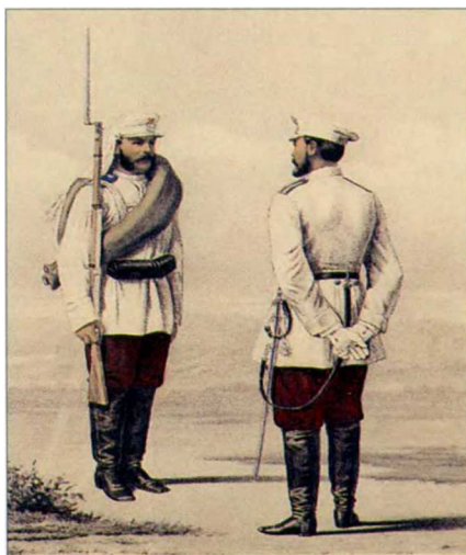
Рисунок 1. Офицер и солдат в белых гимнастерках.

Хотелось бы особо подчеркнуть, что особенностью войск Туркестанского военного округа являлось наличие на эполетах и плечевых погонах офицеров и нижних чинов: в Туркестанских линейных батальонах номера батальона и литеры «Т», а в Туркестанском стрелковом батальоне, Туркестанской саперной роте и Туркестанской артиллерийской бригаде буквы «Т». [7, С. 1165]