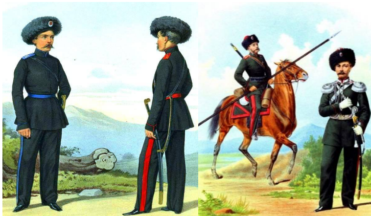
Рисунок 3. Рядовые казаки Оренбургского и Сибирского войск (слева) и рядовой штаб-офицер Семиреченского казачьего войска (справа).

Оренбургского – голубого, Семиречинского – малинового. Казачим офицерам полагались серебряные, чешуйчатые эполеты, с накладным, золоченым № полка, подбитые малиновым сукном. [25, С. 625]