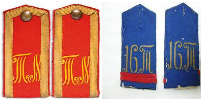
Рисунок 2. Погоны туркестанских войск.

Хотелось бы особо подчеркнуть, что особенностью войск Туркестанского военного округа являлось наличие на эполетах и плечевых погонах офицеров и нижних чинов: в Туркестанских линейных батальонах номера батальона и литеры «Т», а в Туркестанском стрелковом батальоне, Туркестанской саперной роте и Туркестанской артиллерийской бригаде буквы «Т». [7, С. 1165]