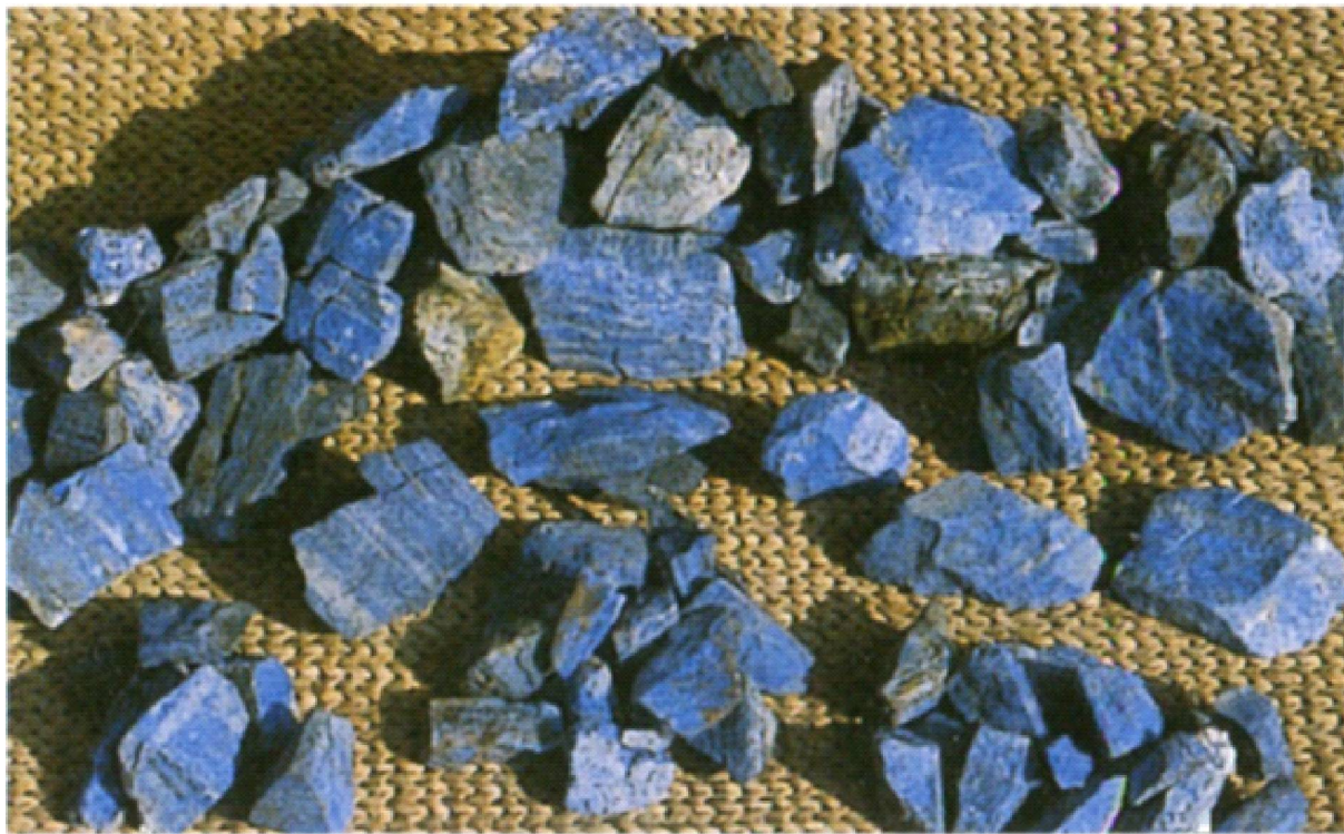
2 расм. Месопотамия. Эбле шаҳар харобаси. Лазурит маъданлари.

лазурити, Эрон хлоридлари ва сердолиги ҳақида маълумотлар учрамайди. Билакс, археологик тадқиқотлар натижасида учрамайдиган, тупроқ қарида сақланмайдиган текстил матолар, озиқ-овқат маҳсулотлари ҳақида хабарлар сақланган [25,Б.154]. Бу ҳолатни тадқиқотчилар Мессопотамия усталари узоқдан келтирилган ушбу қимматбаҳо маъданларни иккинчи ёки учинчи қўлдан олганлиги хусусида фикр билдиради [25,Б.155]. Археологик жиҳатдан кўп учрайдиган маъданлар ва бу маъданлардан турли хил тақинчоқлар ясаган ҳунармандлар ҳақида ҳам ёзма манбаларда маълумотлар келтирилмайди.