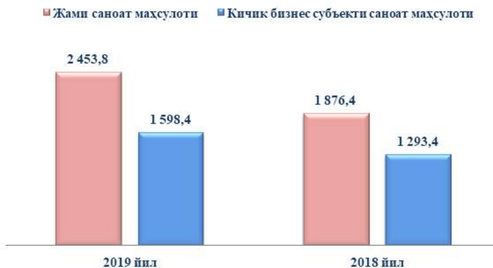
Диаграмма 2. Январь-декабрь ойларида Жиззах шаҳрида саноат маҳсулоти ишлаб чиқаришнинг таркиби (млрд. сўмда)

Давлат ва хусусий секторнинг ўзаро муносабати мамлакатдаги ижтимоий-