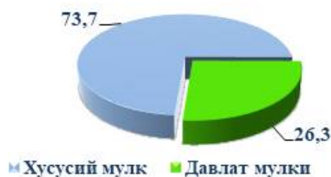
Диаграмма 3. Саноат маҳсулотлари ишлаб чиқариш давлат ва нодавлат секторларида (фоиз ҳисобидаги улуши)

Ривожланган хорижий давлатлар тажрибаси шуни кўрсатадики, саноат мамлакатнинг ижтимоий-иқтисодий ривожланишида муҳим ўрин тутаяди.