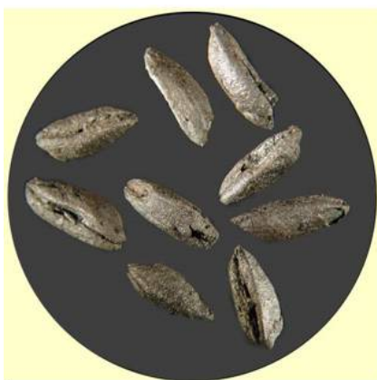
1 расм. Шимолий Суриянинг Косак Шамали археологик қазилмасидан олинган янчилган буғдой донлари.

Бошоқли донларни янчадиган асбобларнинг илоҳийлаштирилиши, нафақат Иерихон, балки Натуфиан маданиятига оид бошқа ёдгорликларга ҳам хос (Хайоним, Нахаль Орен, Айн-Маллаха) [3].