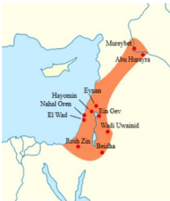
2 расм. Натуфиан маданияти ёдгорликлари ва уларнинг тарқалиш географияси.

ерда дон сақлашга мўлжалланган, сувалган ертўла ва унинг ёнида донни янчиб ун қилиш учун ишлатиладиган ҳавонча ва ўғирдасталар топилган [1]. Қазилмалар давомида буғдой, ловия, бодом каби ўсимликларнинг донлари ҳам учраган. Палеоботаника фани хулосалари бўйича айтадиган бўлсак, инсоният бу даврда бошоқли донларни (буғдой, арпа, сўли) маданийлаштирмаган бўлиб, тадқиқотчиларнинг фикрига кўра Иерихон омбори ва ўғирлари ёввойи буғдойларни сақлаш ва янчишга мўлжалланган, аммо ўғир ва ҳавончаларнинг айнан ибодатхоналардан ва қабрлардан топилиши масалага жиддийроқ ёндашишни талаб этади [2].