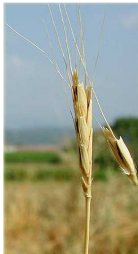
5 расм. Ёвойи буғдой

Авестанинг дастлабки қисмларида буғдой, дон экилган далалар жуда кам тилга олинади [27]. Йасна 42.2;