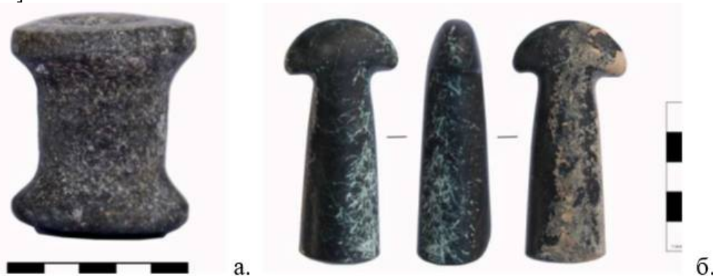
3 расм. Бургуттепа ўғири (а) ва ўғир дастаси (б). Сурхондарё.

Қадимги Шарқда хлорит ёки стеатитдан ясалган ўғир ва ўғирдасталар Месопотамиянинг Убейд, Хафаджа, Телло, Бисмиё, Аграб, Ниппур, Мари ва бошқа манзилгоҳлардаги ибодатхоналар ва бой қабрлардан топилган. Жуда кўплаб шундай топилмалар Эрон ҳудудида жойлашган Тепа Яхё [8], Жирофт [9] ёдгорликларида ҳам қайд этилган [10].